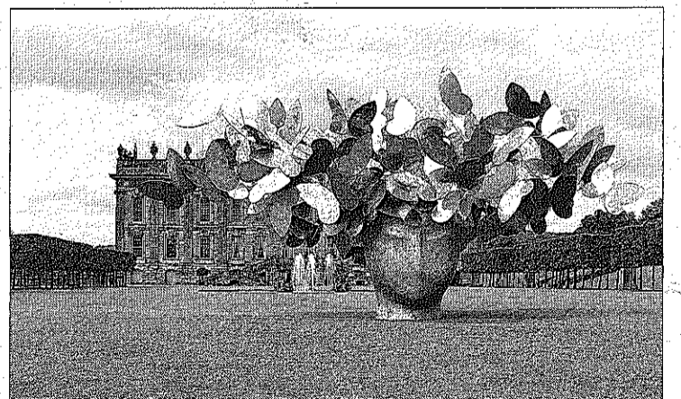
La escultura de Valdés, frente al palacio de Devonshire.

Valdés tiene ahora expuestas en la avenida Broadway de Nueva York (desde mayo hasta en enero de 2011) algunas de sus esculturas de gran tamaño por iniciativa de la galería Marlborough.