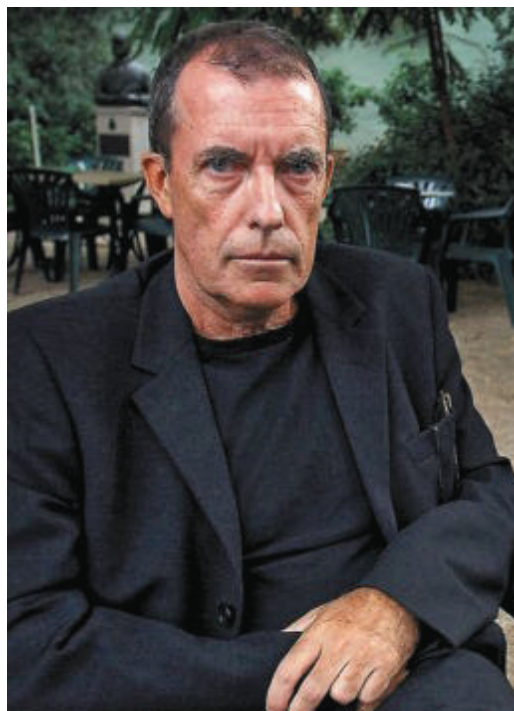
L'escriptor Miquel de Palol.

Aquesta qüestió del canó literari —què és, com es construeix i com i qui l'administra— capfica molt els mentors culturals de Catalunya, potser perquè intueixen que la tradició en la nostra llengua és fràgil, o perquè noten que la xifra de lectors atents (la massa crítica, se'n diu ara també) es va diluint de pressa. Que sense una tradició sòlida no pot haver-hi creació digna de ser tinguda en compte, em sembla una obvietat que no requereix demostració. Que sense públic no pot haver-hi literatura de cap mena —ni digna ni indigna—, ho trobe més obvi encara. Potser a causa d'aquesta inquietud de fons, la revista Cultura ha dedicat el seu sisè número a El canó literari i la transmissió de la tradició . Com de cos-