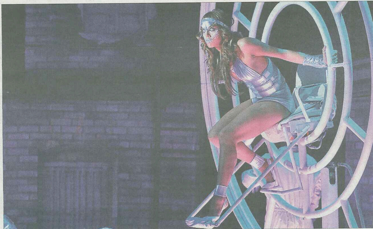
►► Una imatge de l'espectacular musical que ofereix les cançons més significatives de Mecano.

Oferta: localitats per veure l'obra Silencis . Preu: 6 euros per als socis del club TR3SC. Data: divendres 12, dissabte 13 i diumenge 14, a les nou del vespre. Espai: Teatre del Raval (Sant Antoni Abat, 12, de Barcelona). Forma de participació: trucant al telèfon 902.10.12.12 (Tel-Entrada) o entrant a la pàgina web www.telentrada.com .