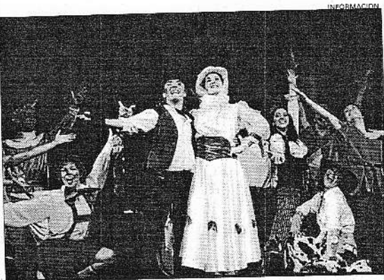
Algunos de los integrantes del reparto de «Magical»

espacio onírico de gran belleza. Todo ello completado con una serie de elementos audiovisuales que crean un espacio sonoro.