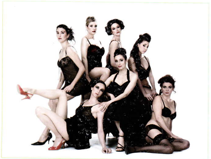
Confesiones de siete mujeres pecando solas de Bramant Teatre