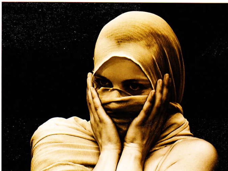
Silencis de Ferriviaría