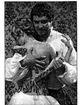
Una escena de La fierrecilla domada .