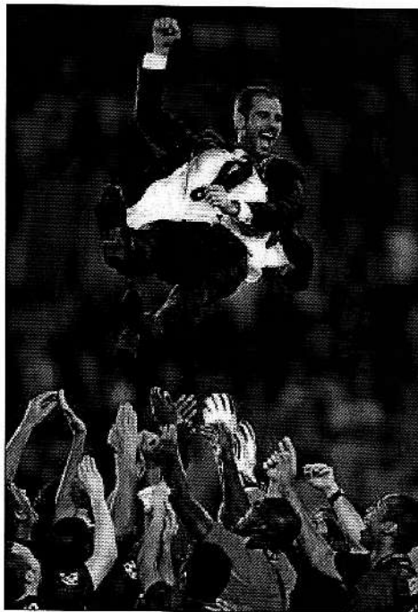
Els jugadors del Barça enlairen Pep Guardiola després de guanyar.