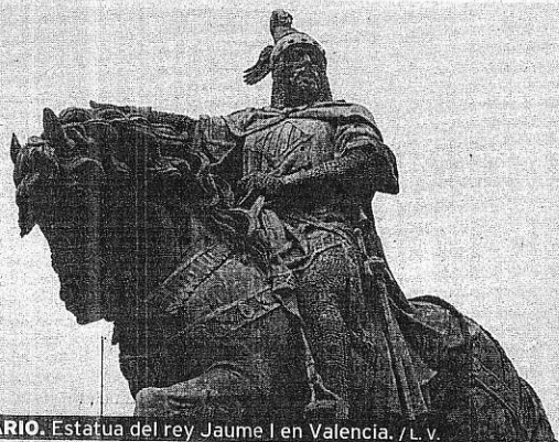
LEGENDARIO. Estatua del rey Jaime I en Valencia.