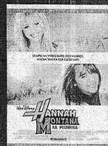
ESTRENO VIERNES 8 DE MAYO

Venta anticipada de entradas: por teléfono 902 22 09 22 - por internet www.yelmocines.es