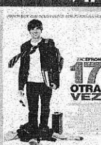
17 OTRA VEZ