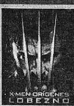
X-MEN ORIGINES: LOBEZNO