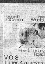
V.O.S. Lunes 4 a jueves 7